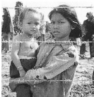
En se réfugiant derrière les civils, les combattants bénéficient d'une considérable manne financière